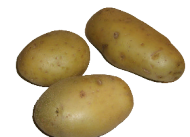
pomme de terre